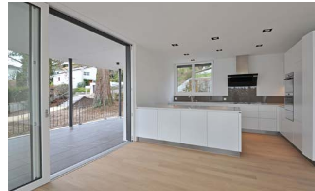
Beispiel einer Küche