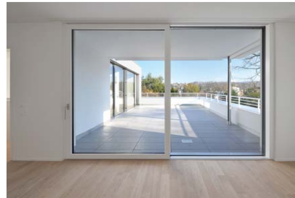
Beispiel Schlafzimmer mit Terrasse