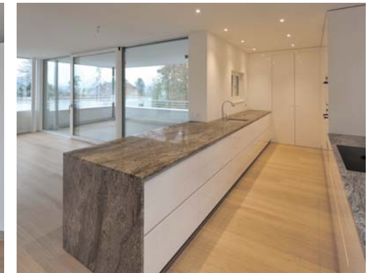
Beispiel einer Küche