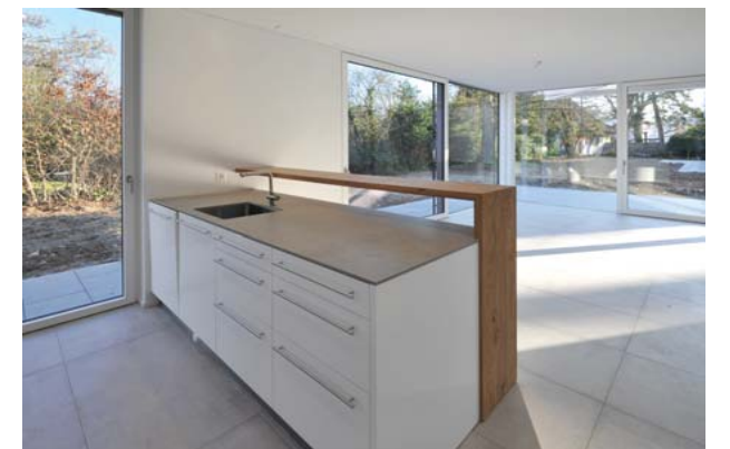
Beispiel einer Küche